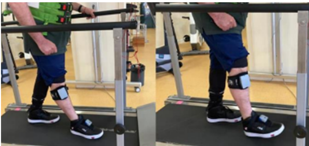
Figura 2. Entrenamiento con el dispositivo de neurorrehabilitación de la marcha Fesia Walk en cinta rodante.

El dispositivo de neurorrehabilitación de la marcha Fesia Walk se puede utilizar con programación específica para activar la flexión plantar en la fase del impulso. Se descartaron otras terapias rehabilitadoras como ortesis y toxina botulínica.